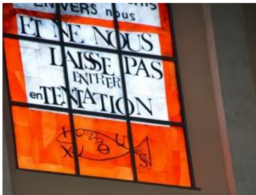
Vitrail de la Basilique du Sacré-Coeur à Grenoble, réalisé par Arcabas.

Cette prière vient de l'Évangile de Matthieu (Mt 6, 9-13) et il en existe une autre version, plus brève, dans l'Évangile de Luc (11, 2-4). C'est à partir de ces deux textes qu'a été composée la prière du « Notre Père » que nous connaissons aujourd'hui.